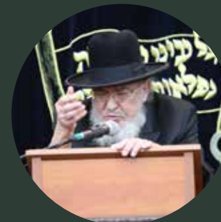
4 | מרן הגאון הגדול רבי ברוך מרדכי אזרחי שליט"א ראש ישיבת עטרת ישראל וחבר מועצה"ת