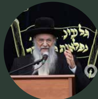
8 | הגאון הגדול רבי יעקב הלל שליט"א ראש ישיבת אהבת שלום