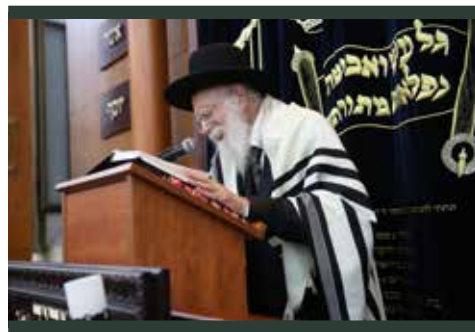
באמירת אבינו מלכינו

ומתוך זו"ל: אכן התבאר הענין עפ"י מאמרם (שמות רבה כא ז), שישראל נתונים בדין, מה אלו אף אלו, ודבר ידוע הוא כי כוח הרחמים הוא מעשים טובים, כאשר יעשה אותם האדם למטה יוסיפו לו כוח במידת הרחמים וכו'. והנה לצד שראה א-ל עליון כי ישראל קטרגה עליהם מדת הדין, והן אמת כי חפץ ה' לצדק ישראל, אבל אין כח ברחמים לצד מעשיהם כזכר, אשר על כן אמר למשה תשובה נצחת 'מה תצעק אלי', פירוש כי אין הדבר תלוי בידי הגם שאני חפץ עשות נס, כיון שהם אינם ראויים, מדת הדין מונעת ואין כח ברחמים כנגד מדת הדין המונעת עכ"ל. ומבואר, שקודשא בריך הוא אומר 'מה תצעק אלי', שהרי אין הדבר תלוי בידי, שאף שאני חפץ לעשות נס, אין כח רחמים כנגד מידת הדין המונעת.