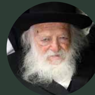
3 | דברי מרן שר התורה רבינו הגר"ח קנייבסקי שליט"א