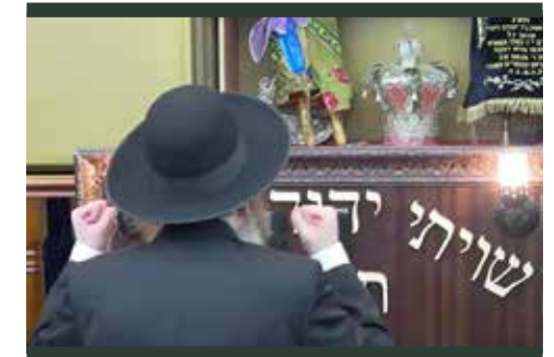
בקבלת עול מלכות שמים

איך הוא שמר על גחלת הישיבות, גחלת התורה, כל ראשי הישיבות אומרים, וכל האדמו"רים, כולם המומים, באיזה שמירה מעולה שמר שלא יפגם זיו כל שהוא ממסורת הקדושה בתורה הק' מכל הדורות, שכל הישיבות הקדושות ימשיכו בקדושה ובטהרה עם יר"ש. דאג שלא יהיה סטייה חלילה מקדושת התורה ומקדושת הישיבות. כמה דאג לבחורים, עד כדי שזה היה לעיתים קשה לראשי הישיבה, כשהוא כ"כ לא נתן לזרוק בחור, כמובן בגבול מסוים, כשהבחור אינו מקלקל ח"ו. הוא טען, לאן הבחור ילך?, לרחוב, עם כל הפיתויים? ואכן באמת כמה וכמה בחורים זכו להישאר בישיבות הקדושות בזכותו. את כל הלב מסר עבור בני הישיבות.