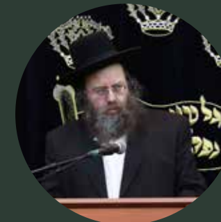
29 | חדב"נ הגאון רבי זליג ברוורמן שליט"א ראש ישיבת סדיגורה